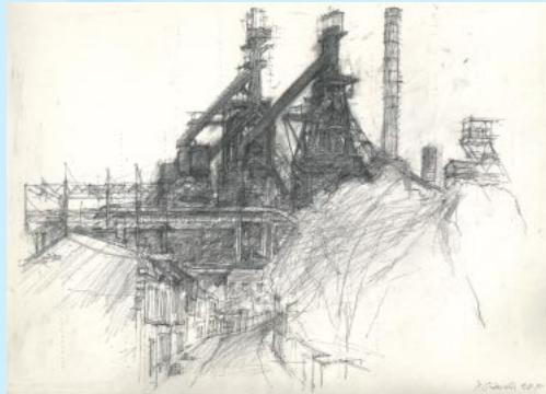
Vue de Seraing

Qu'un artiste viennois se prenne de passion pour l'esthétique de Seraing-bas et d'Ougrée et que cette passion dure depuis trente ans, voilà qui n'est pas banal. Rudolf Schönwald, puisque c'est de lui qu'il s'agit, a découvert le Pays de Liège